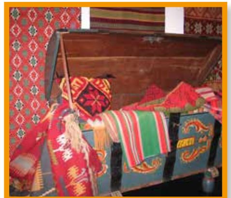
Skånska vävnader på Møllegården kultur i Åkarp.

För de flesta är Charlotte Weibull mest känd just för sina dockor, men hennes unika samling har också spelat en stor roll för bevarandet av den svenska allmogens dräkter och textiler. 2010 doneras dessa till Burlövs kommun och blir en del av kulturhuset Møllegården kulturs verksamhet. Här fortsätter vi i Charlottes anda att uppmuntra till slöjd och eget skapande och arbetar för att förvalta den kunskap, inspiration och glädje för hantverket som Charlotte har lämnat efter sig.