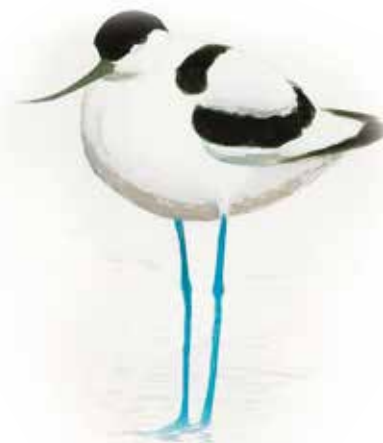
Skärfläcka är Burlövs kommunfågel

Burlövs kommun, Samhällsbyggnadsförvaltningen- Miljö- och byggavdelningen Box 53, 232 21 Arlöv