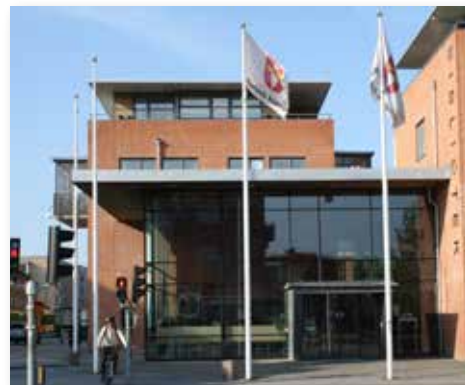
Biblioteket i Burlöv kommer också att vara stängt under hela vecka 40.

Till sommaren 2016 räknar vi med att även ha löst transporter mellan biblioteken så det blir möjligt att fritt reservera böcker som finns i Lomma och fullt utnyttja det gemensamma systemet. Vi hoppas att alla kommer att uppleva det positivt och som en förbättring att få tillgång till fler bibliotek och ett större sortiment.