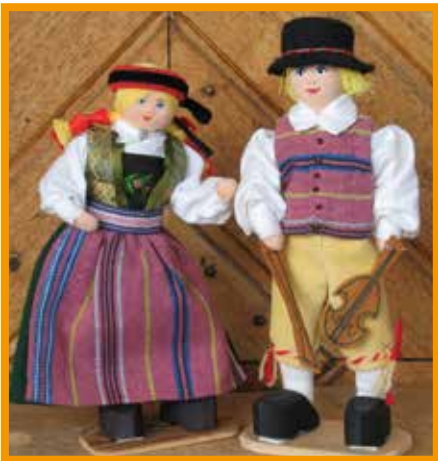
Två dockor i nationaldräkt.