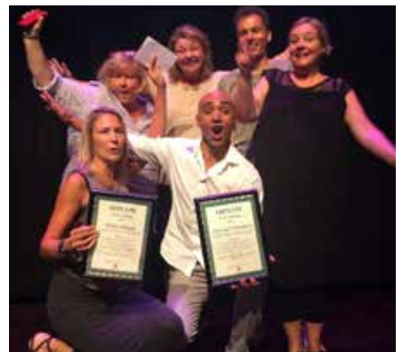
Arbetslag 8 på Vårboskolan.

Ett innovativt lag som ser alla elever och tar till vara på deras kunskaper och utveckling på ett fantastiskt sätt. Ett lag som tillsammans satsar på utveckling, både vad gäller undervisning och i det dagliga mötet med eleverna. Eleverna får daglig feedback och utmanande frågor vilket har höjt deras resultat. De för ständiga pedagogiska diskussioner som de gärna delar med sig av till övriga kollegor, både inom skolan och i det utvidgade kollegiet.