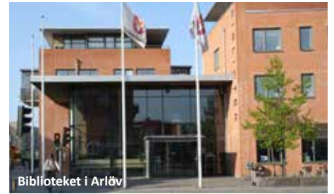
Biblioteket i Arlöv

Din insats kan också vara att erbjuda någon att komma hem på kvällsmat i din familj, eller följa med på en utflykt någonstans. Kom gärna med egna idéer! Inga pengar får vara inblandade och det ska handla om språkträning, kultur och integration. Det kan vara en engångshändelse eller återkommande möten.