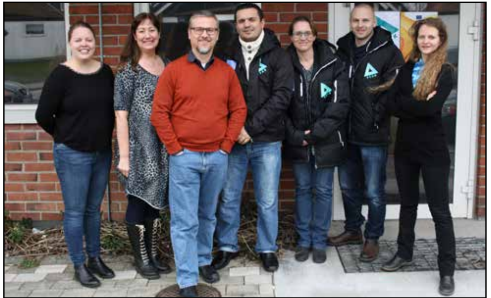
PEAK är ett samarbete mellan arbetsmarknadsenheten, vuxenenheten, Komvux, gymnasieenheten och ungdomsgruppen i Burlövs kommun samt Arbetsförmedlingen Arlöv och Folkhögskolan Hvilan.

PEAK är en mötesplats där ungdomar har möjlighet att få information och stöd från de olika verksamheterna på ett och samma ställe. I samverkan satsar vi på att stärka ungdomarnas delaktighet och förmåga att påverka sitt eget liv.