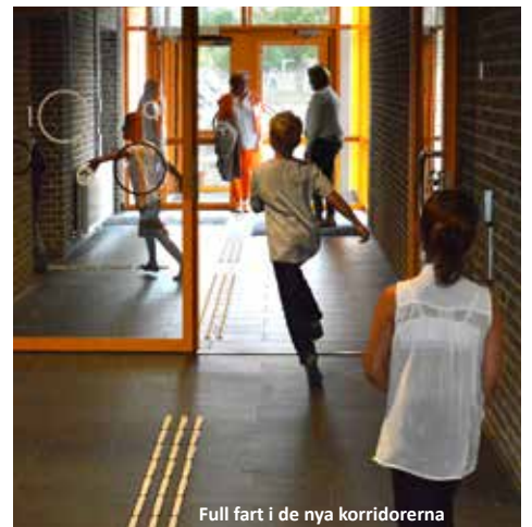
Full fart i de nya korridorerna