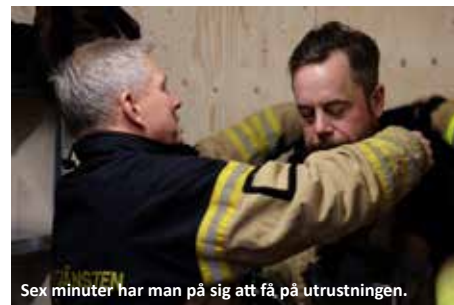
Sex minuter har man på sig att få på utrustningen.

Som Räddningspersonal i beredskap (RiB) har man beredskap i snitt var fjärde vecka. När man då får larm på sin personsökare måste man ta sig från sitt hem eller från sitt huvudarbete till brandstationen, klä på sig larmkläder och kunna åka ut med brandbilen inom sex minuter. Med andra ord måste du bo eller arbeta inom cirka fem minuter från våra deltidsstationer.