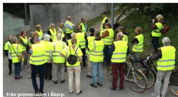
Från promenaden i Åkarp.

Det kostar ingenting att vara med och du väljer själv hur du vill delta: genom mejl eller telefonkontakt eller på något av de möten som vi kommer att anordna. Mejla dina kontaktuppgifter till: kommunikation@burlov.se eller gå in på www.burlov.se/medborgardialog och fyll i dina uppgifter där så kontaktar vi dig cirka två gånger