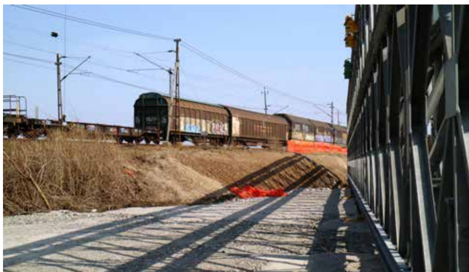
Den tillfälliga bron byggs upp på Gränsvägen i Åkarp.

Lösningen med två broar för Gränsvägen kom till under arbetet med järnvägsplanen. Bron som planerades till en början blev hög, eftersom den skulle klara dagens spår, de som går i marknivå, och