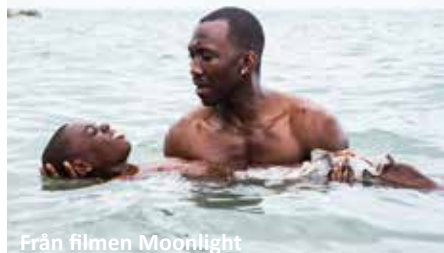
Från filmen Moonlight

Ett intimt porträtt av en ung mans liv från barndomen till vuxen ålder, när han växer upp i ett tufft område utanför Miami. Arlövs bibliotek kl. 14.00.