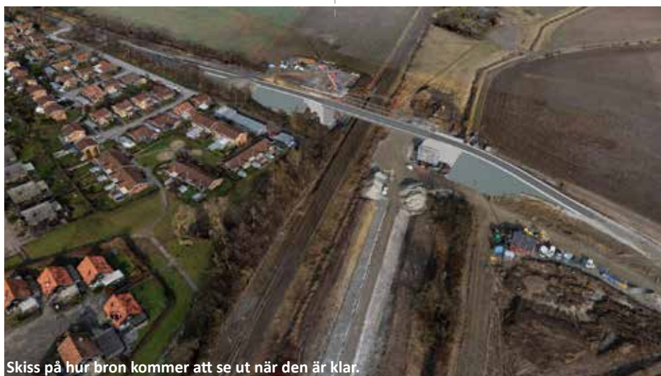
Skiss på hur bron kommer att se ut när den är klar.

Den tillfälliga bron vid Gränsvägen är en så kallad beredskapsbro av "militär" typ. Trafikverket använder sådana broar till exempel vid broreparationer eller vid byggen då tillfälliga broar behövs. Bron har monterats ihop likt en gigantisk byggsats intill det östra brofästet. Bron är cirka 65 meter lång, 10 meter bred och väger cirka 160 ton. Under våren kommer bron att lyftas på plats. Lyftkranen med vilken arbetet utförs är mer än 50 meter hög och klarar att lyfta över 200 ton. Bara att montera kranen tar cirka en vecka och marken där kranen ska stå har förstärkts för att klara lasterna under det tunga lyftet.