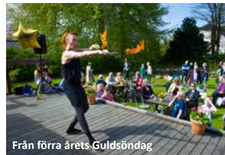
Från förra årets Guldsöndag

Ta med vänner, familj, kollegor eller andra i ditt nätverk.