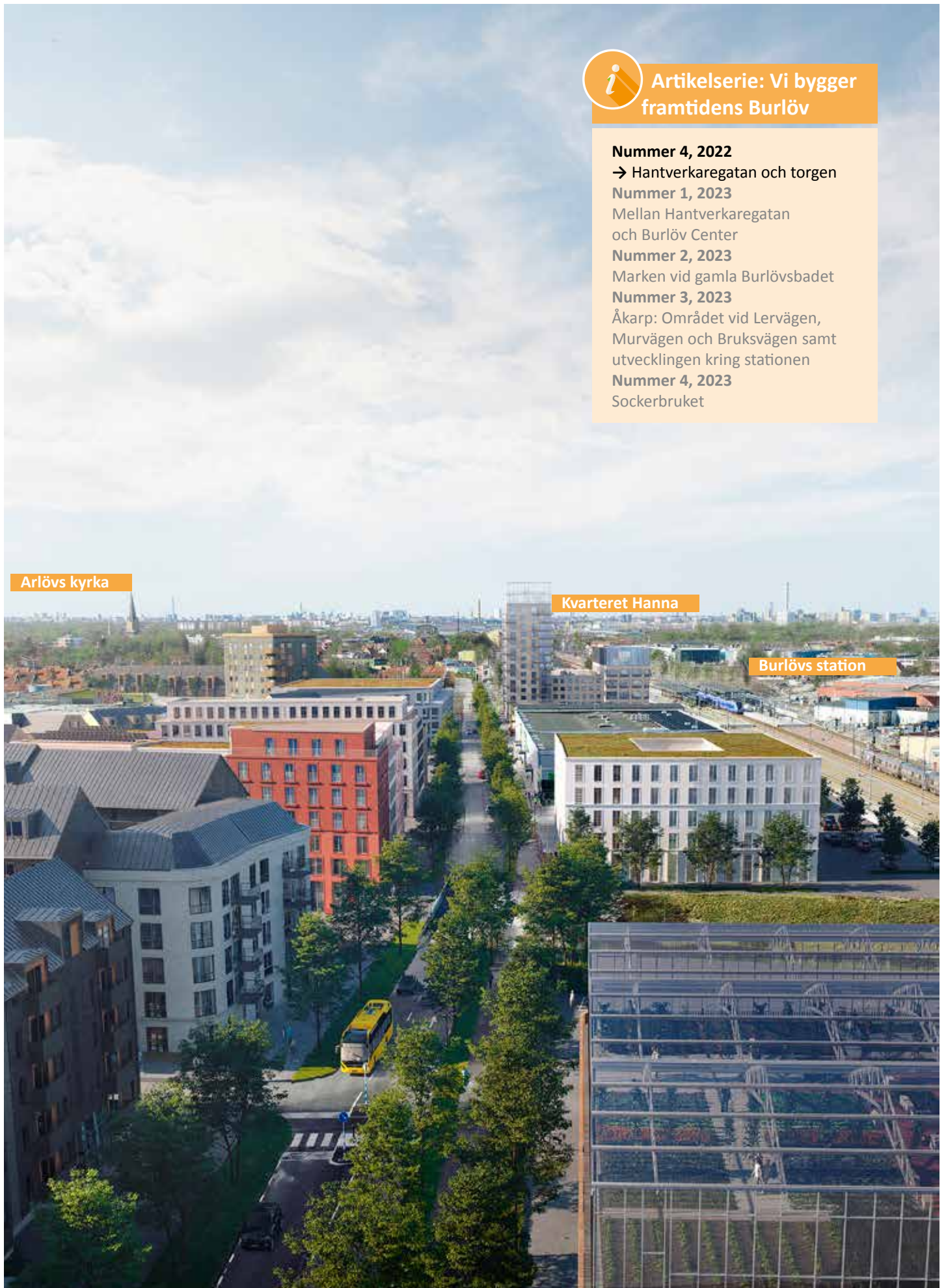
Visionskiss av hur Hantverkaregatan från badet ner mot Burlövs station skulle kunna se ut i framtiden.